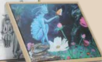
Éclosionne Pierre de lune