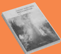
Malu à contre-vent Clarence ANGLE SABIN

LES 3 ROMANS FINALISTES DU PRIX "JEUNE MOUSQUETAIRE"