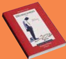
Décrochages Julien FYOT