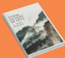
11h02 le vent se lève Sacha BERTRAND