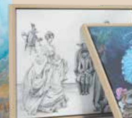
Modiste et tailleur